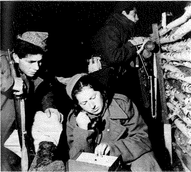
באש קרבות – לוחם ולוחמת בקרבות תש"ח. עשרות יישובים היו נצורים. בן שמן היה נתון במצור מספר חודשים

חייל הצופה במשקפתו ובמרכזו כותרת – "על המצפה, בטאון הפלוגה הדתית בבסיס בן שמן".